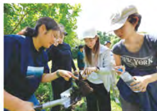
環境アセスメント実習