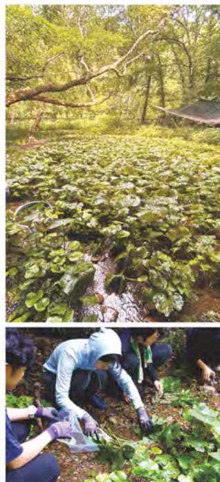
三鷹大沢わさび再生プロジェクト