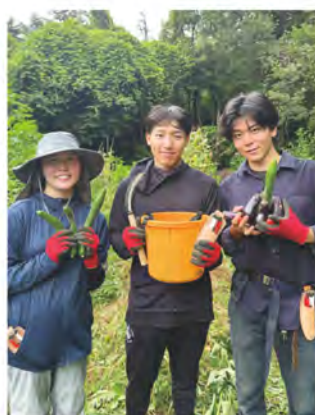
ファームプロジェクト