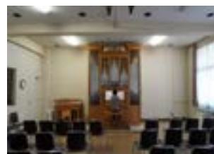
オルガン受講生の演奏風景