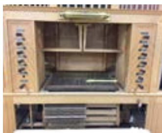
森オルガン解体の様子